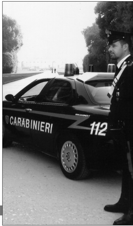
Un controllo dei carabinieri

Si è fermato in una piazzola di sosta della strada statale 7 bis. E' stato ammanettato dai carabinieri e condotto presso il carcere